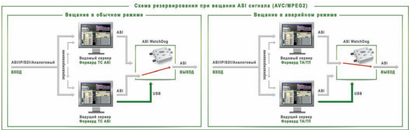
Схема резервирования при вещании ASI-сигнала (AVC/MPEG-2)

В схеме «Зеркало», показанной на рисунке, выходные IP-сигналы с ведущего и ведомого серверов поступают на третий компьютер. На нем устанавливается ПО «Форвард ТС Шлюз IP-IP». В его настройках указываются IP-адреса основного (с ведущего сервера) и дополнительного (с ведомого серверов) сигналов. В случае пропадания основного сигнала происходит автоматическое переключение на прием сигнала с резервного IP-адреса. Третий компьютер выполняет роли и WatchDog, и коммутатора одновременно. Понятие «ведущий/ведомый сервер» при работе с IP-потоками является условным.