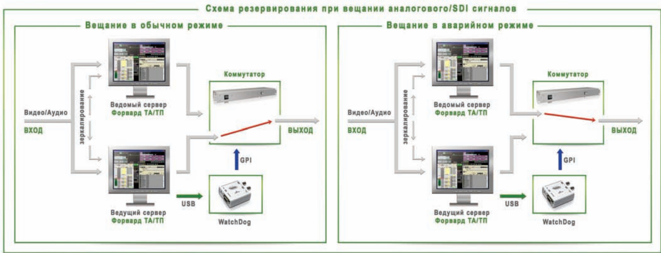
Схема зеркального резервирования при вещании аналоговых и SDI-сигналов

веру через USB-интерфейс подсоединено специальное устройство Forward WatchDog Box (WatchDog) собственной разработки компании, а оно в свою очередь подключено к блоку обхода для управления им по GPI.