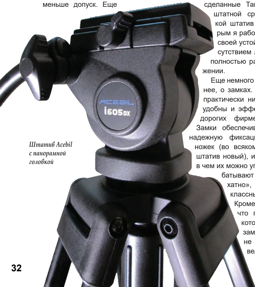
Штатив Acebil с панорамной головкой

Теперь к головке. Первое, с чем скорее всего придется столкнуться, это камерная площадка. Тут тоже надо обращать внимание на размеры площадки и на то, как она садится в паз. Зачастую недорогие головки оснащаются короткими площадками, что не сокращает возможности балансировки съемочной системы. Да и нередко случается, что площадка в пазе болтается, и единственный способ с этим бороться – намертво зафиксировать ее соответствующим зажимом. Но и здесь Acebil порадовал – камерная площадка его панорамной головки имела соответствующий размер и не болталась в пазе. Следует отметить, что как и большинство недорогих головок, Acebil не имеет системы контрбаланса и механизма демпфирования, позволяющего регулировать усилие сопротивления панорамированию. В таких головках и контрбаланс, и усилие демпфирования установлены в некое среднее значение, чего, в