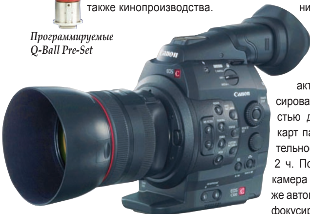
Canon EOS C300

столь высокоразрешающие экраны в своих домах или на рабочих столах. Разрешение дисплея в 8K все чаще рассматривается как переходной формат к предложенному NHK 32-мегапиксельному сверхвысокоразрешающему формату. Дополнительной причиной для продвижения разрешения экрана свыше 2K является компенсация потери горизонтального разрешения, вероятного для автостереоскопических экранов, которые станут стимулом в распространении 3D-просмотра.