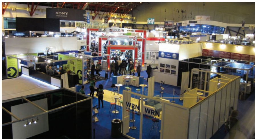
В выставочном павильоне