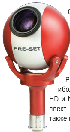
Программируемые Q-Ball Pre-Set

CineForm Studio Premium и GoPro CineForm Studio Professional), предназначенную для применения с миниатюрными видеокамерами этой фирмы. GoPro CineForm Studio Premium «упаковывает» наиболее важные функции Neo HD и Neo 3D от CineForm в комплект для 2D- и 3D-вещания, а также кинопроизводства.