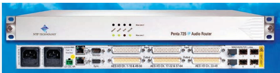
Коммутатор Penta 725 IP

эксплуатационных расходов на сеть, позволяя исключить аренду дорогостоящих специализированных линий связи, традиционно используемых для передачи аудио из региональной радио- или телестудии в штаб-квартиру. Он позволяет выполнять качественное распределение аудио по недорогим IP-каналам Gigabit Ethernet. Для управления служит ПО VMC этой же фирмы, а сам Penta 725 IP может работать в масштабах города, страны и даже мира, обеспечивая раздачу аудио с задержкой не более миллисекунды. Системы Penta 725 IP можно объединять, получая до 512 каналов в одной гигабитной сети. Допускается построение и более крупных систем, если есть достаточная полоса пропускания.