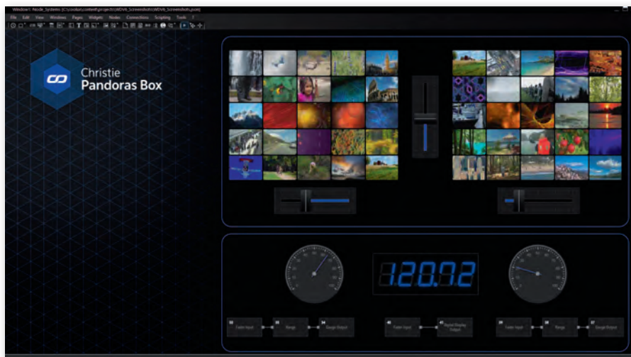
Сервер Pandora's Box (вверху) и интерфейс управления им