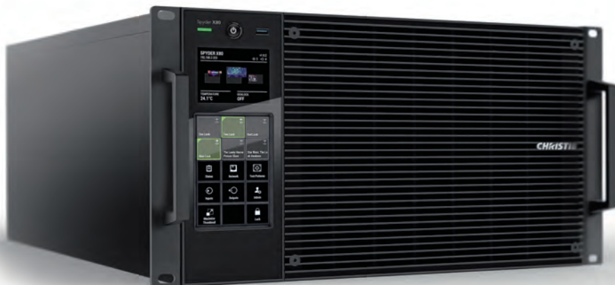
Видеопроцессор Christie Spyder X80

Все наши системы – а они удостоены множества профессиональных наград – обладают особыми достоинствами. У серии Christie Pandoras Box (медиаплееры, серверы, программа создания пользовательского интерфейса и среды взаимодействия) это редактируемые цифровые полотна для маскирования и рисования, редактируемые сетки для быстрого применения свободной де-