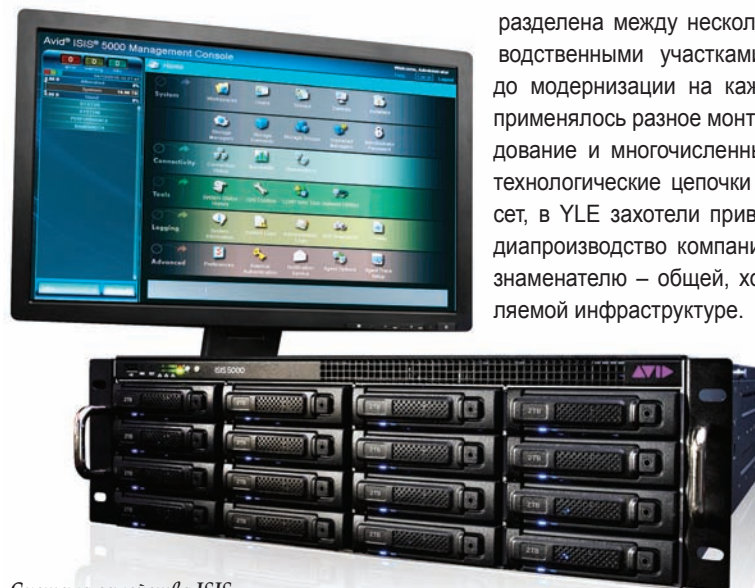
Система семейства ISIS

Ответственность за создание и вещание широкого спектра телепередач YLE, включая сериалы, документальные филь-