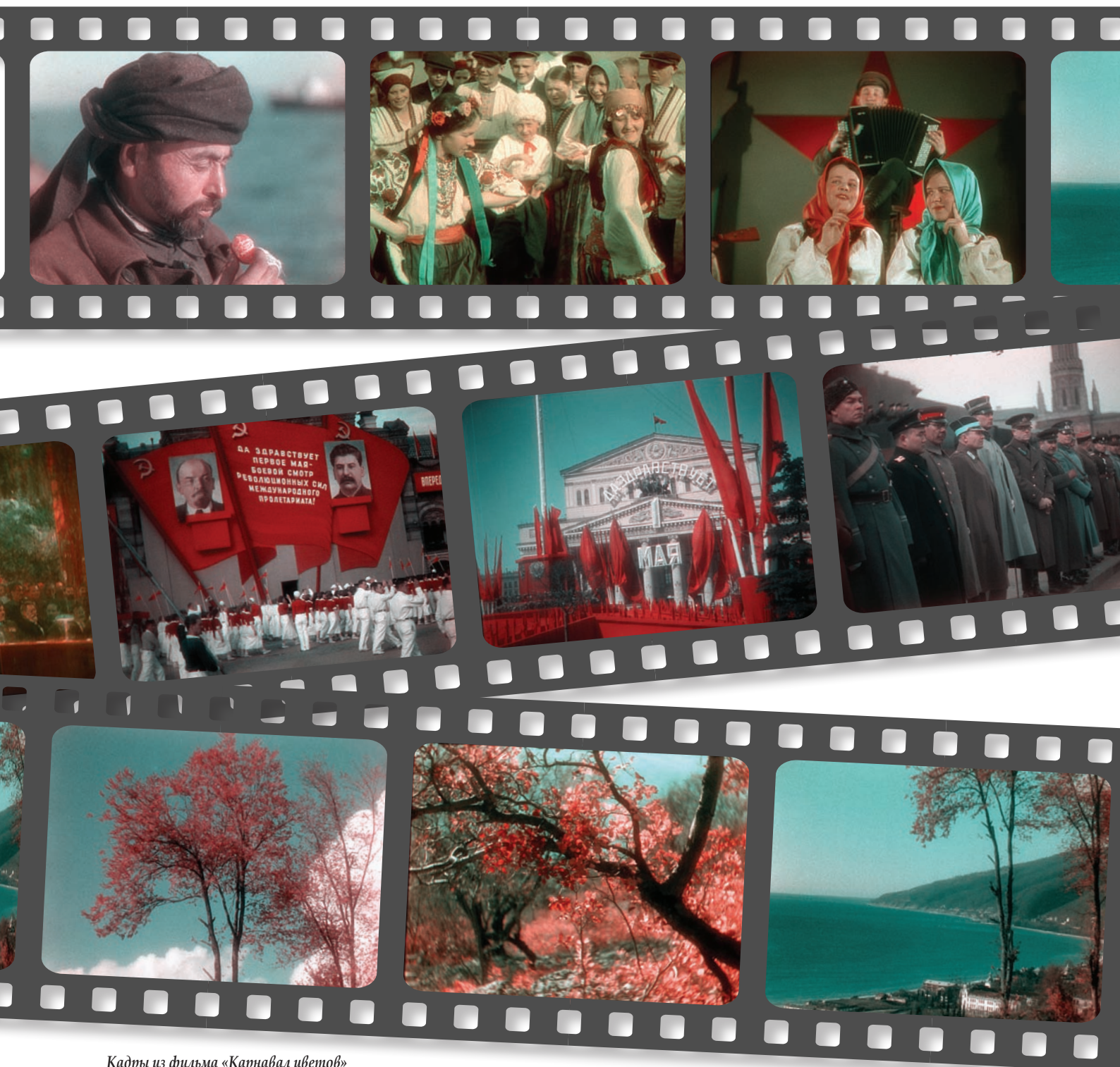
Кадры из фильма «Карнавал цветов»

Практически в каждом плане этих частей есть предметы и детали, цвет которых общеизвестен, что несколько облегчало цветокоррекцию, а в большинстве случаев она вообще не требовалась.