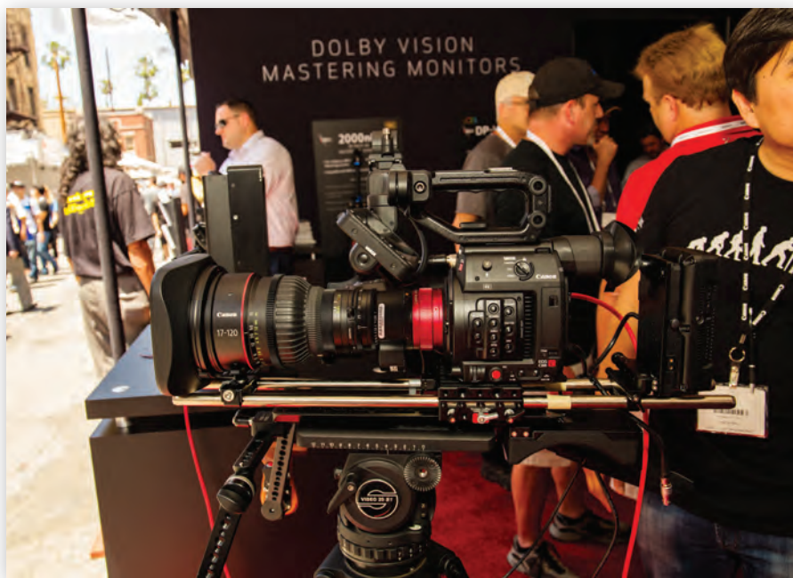
Canon EOS C200 на выставке Cine Gear 2017

Понятно, что карты CFast 2.0 не очень дешевы, но в случае с C200 это не станет непреодолимым препятствием. Видео 4K UHD с потоком 150 Мбит/с можно записывать в старом добром MP4 на карты SD соответствующего класса. А поток в формате HD – привычные 35 Мбит/с, которые без труда «проглатывают» даже совсем недорогие карты. Правда, динамический диапазон здесь сокращается до 13 стопов, а цветовое пространство – до 4:2:0. Бонусом служит возможность параллельно записывать на одну карту 4K UHD, а на другую HD.