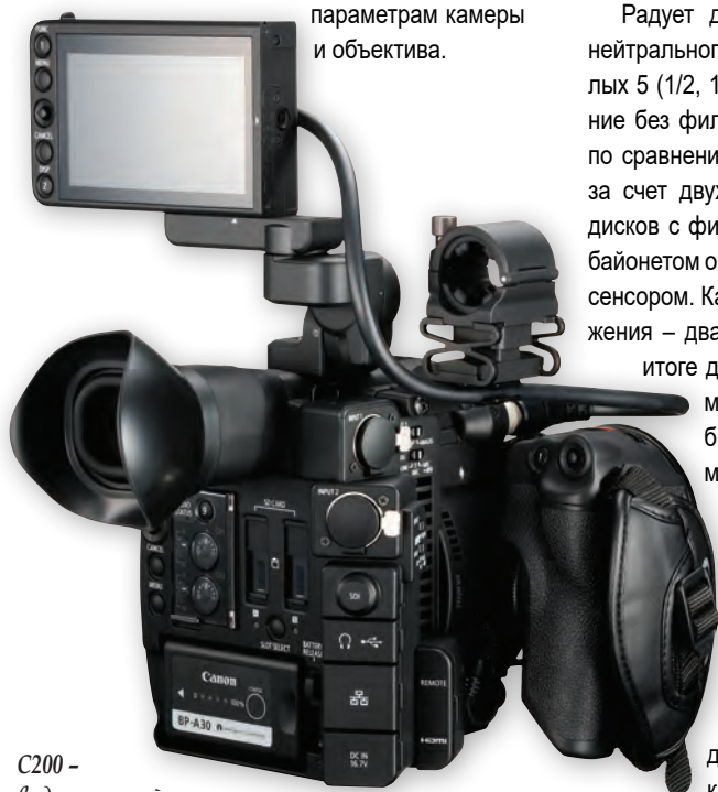
C200 – вид с тыльной стороны

Не разочаровывает и меню. В нем добавлены опции точной подстройки автофокуса, облегчен и ускорен доступ к параметрам камеры и объектива.