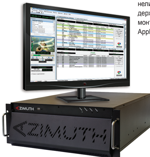
Система автоматизации телевидения AutoPlay 7 и видеосервер Azimuth

Все системы AutoPlay построены на базе системы управления медиаресурсами A-MAM, обеспечивают возможность для унификации и централизации управления. Возможности AutoPlay значительно расширяют систему подготовки и выпуска новостей NewsHouse, подсистема «ВидеоархивЪ», опция IP-вещания. Системы AutoPlay предусматривают 100% резервирование вещания и обеспечивают надежность эфира в режиме 24/7/365.