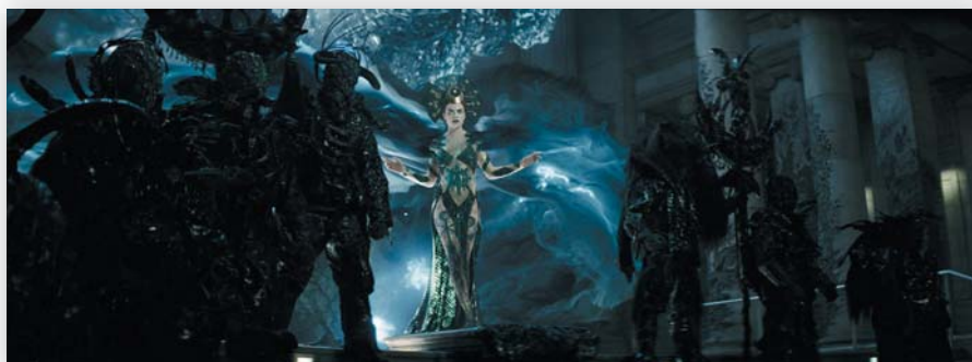
Актриса в образе колдуньи на площадке и после добавления графики