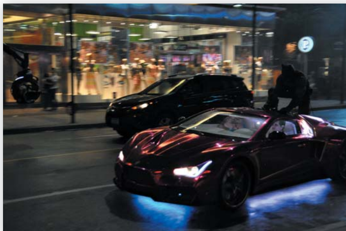
Трюки в картине ставила та же команда, что и для проекта «Безумный Макс: Дорога ярости»

Для каждого актера тренировки стали неотъемлемой частью перевоплощения в персонажей. Мы снимали сцену, где Харли в лифте поднимается на верхние этажи федерального здания. Я помню, как смотрел