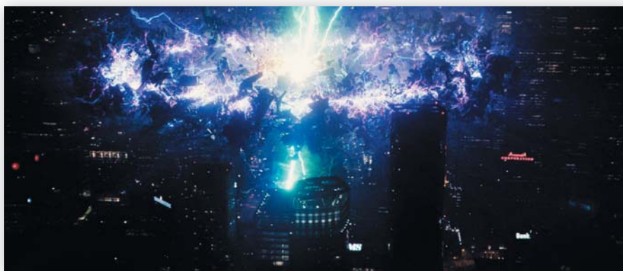
В картине свыше 1 тыс. планов с визуальными эффектами

Создатели фильма и музыкальные супервайзеры Сизон Кент и Гейб Хилфер интегрировали в ленту музыку, которая передала зажигаемость и энергетику опуса, а также подчеркнула основные темы сюжета – искупление, которое, пожалуй, было основной заботой Отряда. Выбирая из широкого спектра мелодий, они заполнили фильм удивительной нарезкой: от классического и альтернативного рока до урбан фанка и