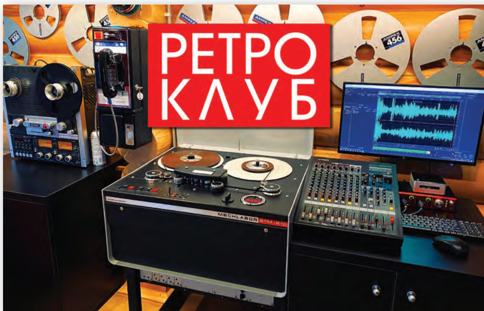
Аппаратная «Ретроclub». В центре – исторический уже аппарат STM-160

Сама оцифровка с ленты не представляет технически сложной задачи: уровни и АЧХ тракта магнитофона настраиваются по измерительной ленте (ЛИМ), при воспроизведении аналоговый стереосигнал по двум симметричным линиям подается на АЦП (внешнее устройство, выполняющее функции карты ввода) и далее по USB3 на PC. Замечу, что в эпоху модных «золотых» кабелей сигнальные кабели на звуковых студиях – обычные медные, а линии – помехозащищенные: симметричные, с двумя противо-