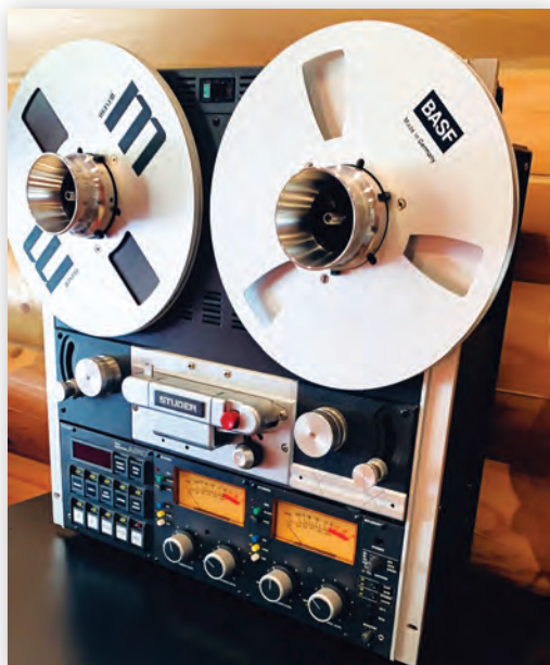
Studer A810 – легенда профессиональной звукозаписи и отличный компаньон для STM-610