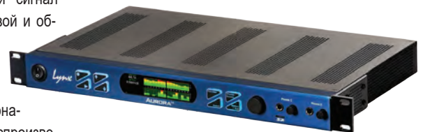
Многоканальный студийный АЦП/ЦАП Lynx Aurora (n)

Рабочую лошадку Focusrite Clarett 2Pre USB скоро заменит более прогрессивный Lynx Aurora (n) – многоканальный студийный АЦП/ЦАП. Причин тому несколько. Во-первых, магнитофонов скоро будет больше и можно будет подать сигналы с них напрямую в АЦП, минуя внешний аналоговый микшер (источник дополнительных шумов). Новый АЦП позволит одновременно записывать в файлы до восьми моноканалов 192 кГц/24 бита или до 16 каналов 96 кГц/24 бита по USB, а это означает, что оцифровку можно будет вести одновременно со всех имеющихся машин, значительно экономя время (полученный многоканальный файл затем легко и быстро разбивается на отдельные стерео-файлы. А во-вторых, превосходные технические характеристики устройства, полученные благодаря оригинальной схемотехнике и помехозащищенной системе питания, позволяют с полным правом отнести Lynx Aurora (n) к категории студийного оборудования.