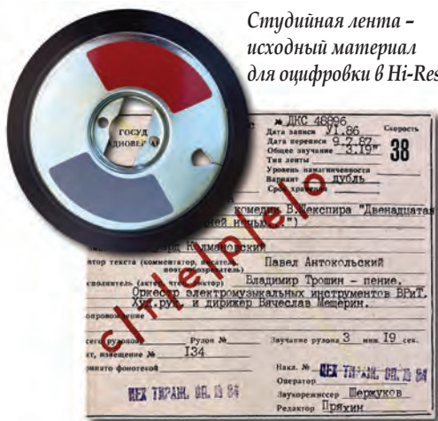
Студийная лента – исходный материал для оцифровки в Hi-Res