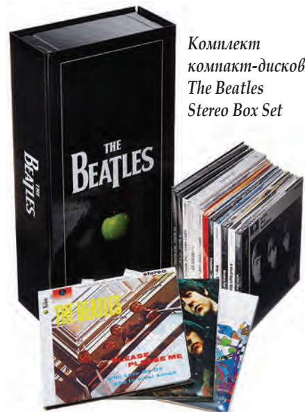
Комплект компакт-дисков The Beatles Stereo Box Set

Повезло, кстати, тем авторам и исполнителям, у кого сохранились многоканальные исходники на дюймовых и двухдюймовых лентах: сегодня их оцифровывают, сводят заново и публикуют в вариантах Stereo 2.0 и 5.1. Тому есть яркий пример с Beatles: к 2009 году был завершён огромный труд по новой оцифровке аналоговых мастер-лент, в том числе многодоро-