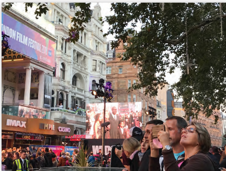
На фестивале – полный аншлаги

Дело еще и в том, что документалистика нового времени, кроме того, что показывает те или иные обстоятельства – природные или социальные, в которые попадает человек, еще и пытается осмыслить эти обстоятельства. В этом и заключается ее новизна. Если раньше это была прерогатива художественной картины, то теперь одно из направлений современной философии, это, несомненно, документальный фильм или, иногда, еще mockumentary – жанр наиболее точного воспроизведения реальности в художественном кино. В этом жанре на фестивале были представлены несколько картин, в том числе «Донбасс» Сергея Лозницы. Но, на мой взгляд, наибольшего