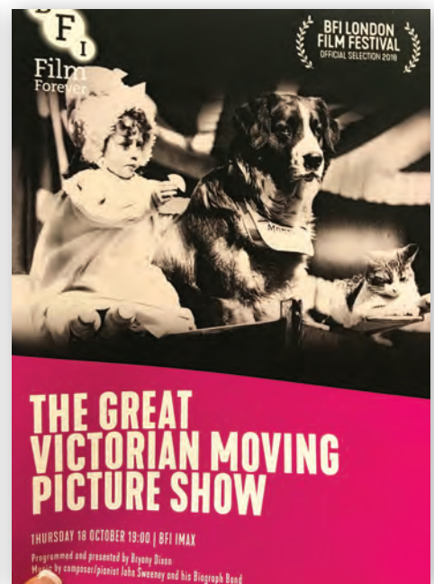
Брошюра, вытущенная к показу кадров Викторианской эпохи