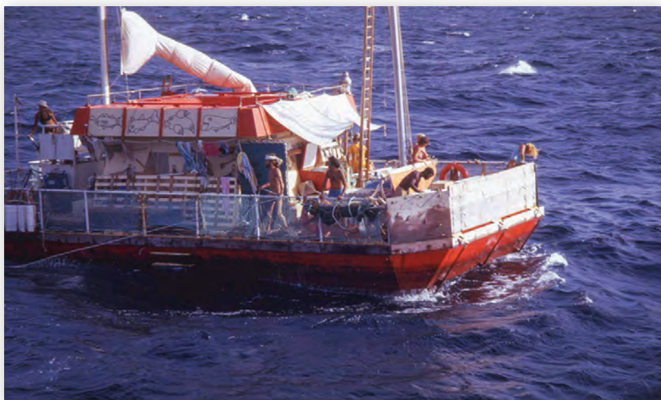
Кадр из фильма The Raft

На самом деле до сих пор существует некий идеологический спор – надо ли показывать старые хроники такими, как их видели современники (пусть даже и с оркестром) или следует их «оживить» – расцветить и озвучить, подобно тому, как это сделал Питер Джексон? Как бы то ни было, я уверена, что все эти фильмы, которые вчера еще были частью фестивальной программы, завтра станут частью школьной. Историю будут изучать по кино- и телехроникам. Берегите ваши архивы и создавайте новые!