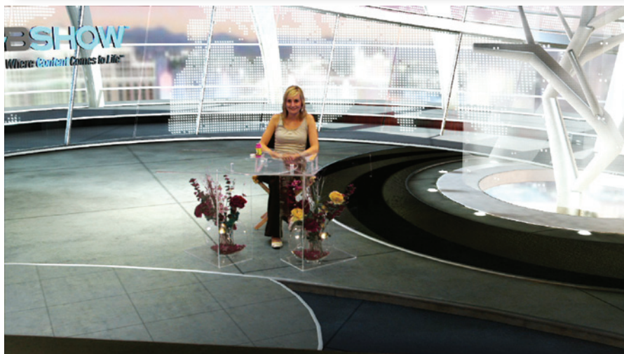
Ведущая на синем фоне и в виртуальной среде после замещения фона графикой