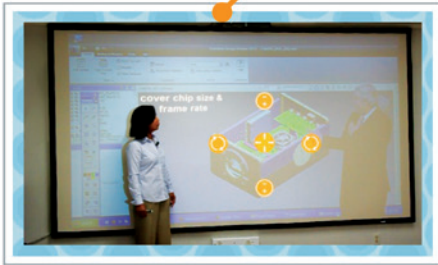
Применение Sightdeck в случае, когда две студии географически удалены друг от друга

Система Sightdeck позволяет работать с фо-